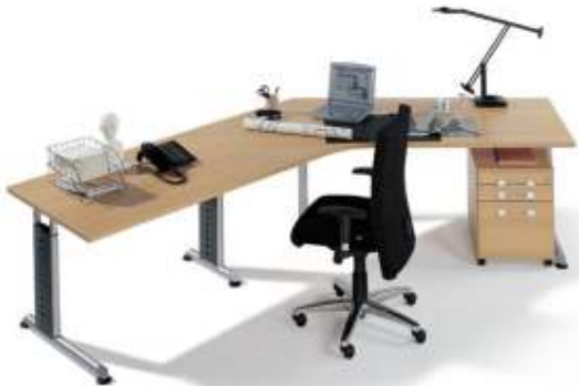
Arbeitsplatzlösung mit linearer Verkettung 135° und Unterbaucontainer