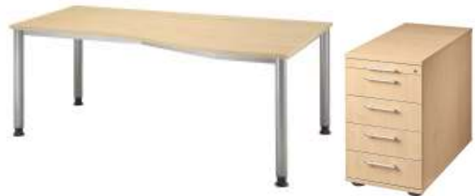
Arbeitsplatzlösung mit Freiformtisch und Standcontainer