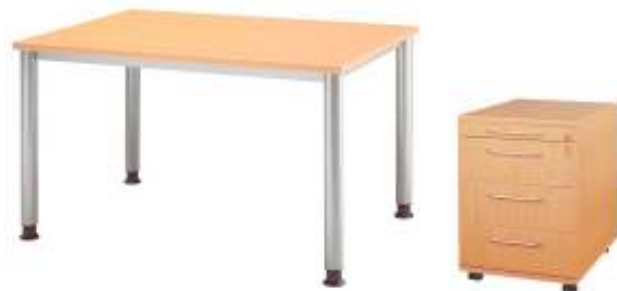
Arbeitsplatzlösung mit Rechtecktisch und Rollcontainer