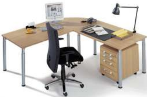
Arbeitsplatzlösung mit linearer Verkettung 90° und Unterbaucontainer